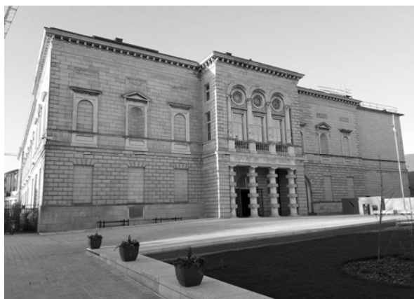
Figura 1. Irlandzka Galeria Narodowa w Dublinie. (a) widok zewnętrzny.